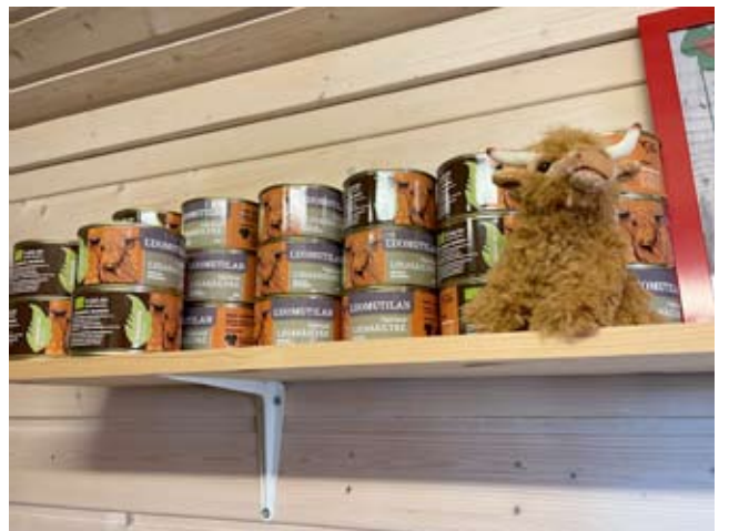
Hyllyllä oli iso joukko täyslihasäilykkeitä, jotka käyvät hyvin kauppansa vaikkapa viiden satsissa.