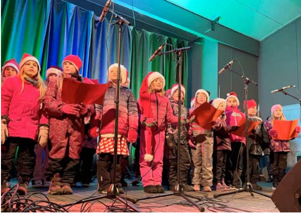
Kirkkomännikön koulun Sointu-kuoro esitti jouluisia lauluja tonttulakit päässä.