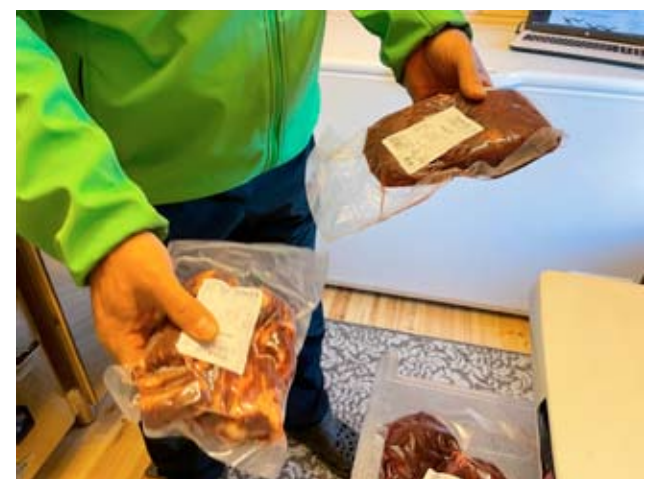
Tilalta on Rekon tilattavissa ja haettavissa myös monia erikoisuuksia kuten naudan poskea ja häntää.