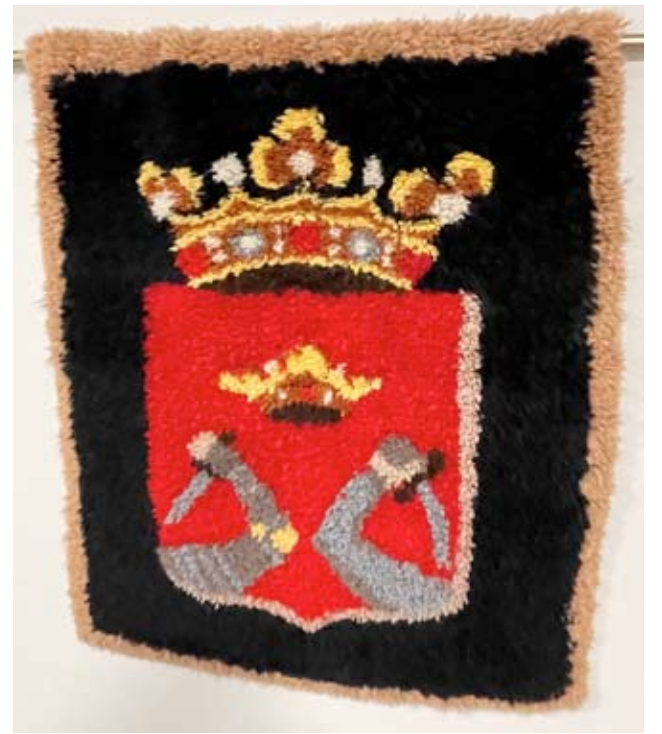
Tämä Makupirtin seinällä nyt ollut ryijy on vuodelta 1939 ja kuva silloista Karjalan vaakunaa.