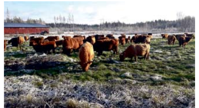
Highlandit laiduntavat ulkona koko vuoden, eivätkä välitä lumesta ja pakkasesta. Karjaa kasvatetaan eettisesti, ja sen liha on lähiruokaa. Tässä karja laiduntaa pihatton takana.