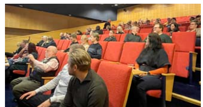
Tuurissa pidetyssä markkinointiseminaarissa oli runsaasti osallistujia, kun puhujiksi oli saatu hyvä kolmikko.

Runsas osanottajajoukko sai nostaa käsiä ylös, mikä Kalliolan kysymyksistä osui kulloinkin nappiin omalle kohdalle.