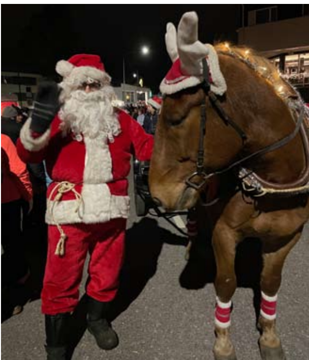
Joulupukki taputteli Lumousta ja tervehti joulunavaukseen tullutta ennätysellisen suurta yleisöä