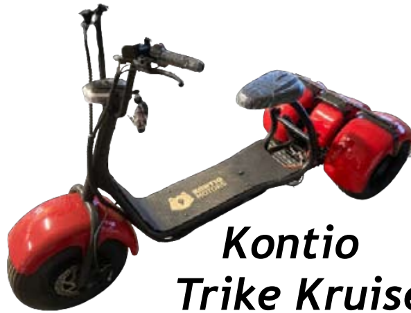
Kontio Trike Kruiser