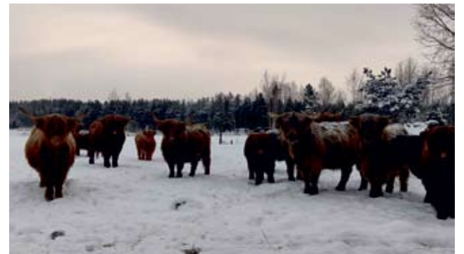
Ylämaan karja ei säily lunta, eikä kireitäkään pakkasia. Karja on sopeutunut ympärivuotiseen ulkokasvatukseen.

Hautamäki Highland ei ole juuri markkinoinut tuotteitaan. Puskaradio on hyvä kauppias. Erityisesti jauheliha on niin tykättyä, että se pakkaa loppua aina.