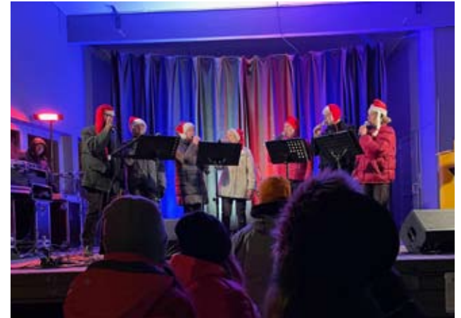
Laulukuoro Amoroso oli nyt jouluisissa tunnelmissa. He pitivät lokakuun lopussa 12-vuotiskonserttinsa.

Ja aivan loppuksi Alavuden taivas valkeni komeasta iltatalkusta.